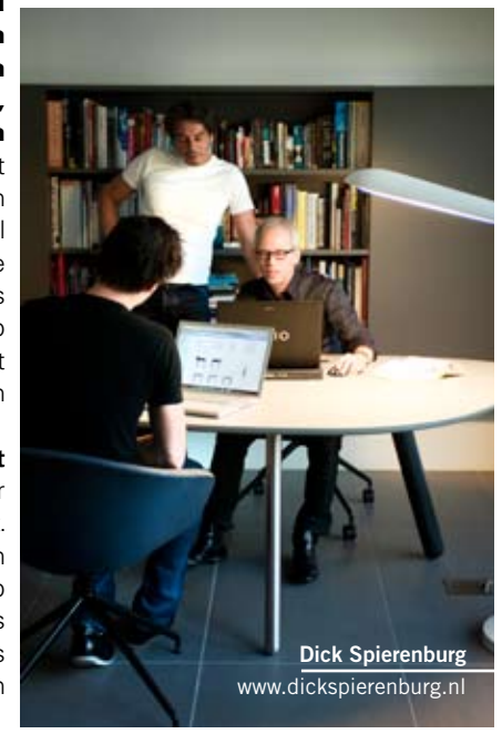
Dick Spierenburg www.dickspierenburg.nl

Een vrouw fietst voorbij. Ze houdt even in en draait haar hoofd. 'Ik kan er alleen maar naar raden wat ze ervan vindt. Misschien had ze hier toch eerder een Hans & Grietje-huis verwacht? Ik hoop alleen maar dat het me is gelukt een huis met toekomstwaarde te bouwen. Zo'n kans zou je jezelf eens in de tien jaar moeten toestaan.' ■