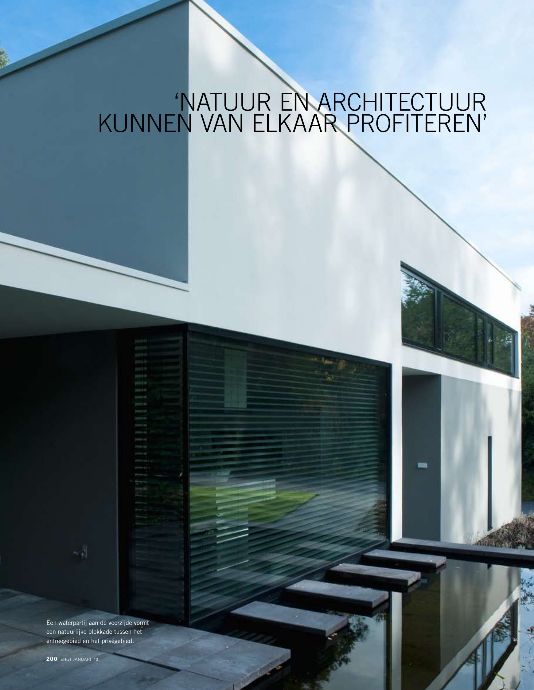
Een waterpartij aan de voorzijde vormt een natuurlijke blokkade tussen het entreegebied en het privégebied.